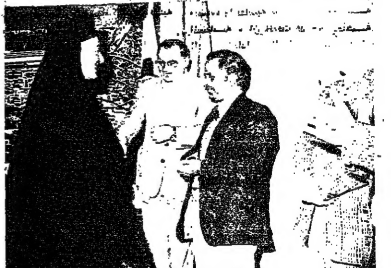
وجاه من الطوائف المسيحية في ضيافة رئيس بلدية حيفا بمناسبة عيد رأس السنة الميلادية

ما زالت مستمرة حتى يومنا هذا ، ولحينا وفي تاريخ الطائفة الدرزية والتمساجية في حياة الدولة .. وتقديرا منا لتأهين القوميين تبنا بالمثل الجاد والبرغم لنسج هذه القرى بالشكليات السياحية العامة التي تتلقى بالبلدية لكوننا نرى في القرية المسيحية من أبناء الطوائف المختلفة ونقسم منطقة البلدية مساحة قدرها ١٤٣٠٠٠ دونم ، بما في ذلك ٥٠٠٠٠ دونم ارضية الجبلية في شهر ايلول سنة ١٩٧٦ ، ولم تكن خاضعة من قبل لاية سلطة بلدية ويحول التقرير ان ٨٠٠٠ دونم من مجموع المساحة الخاضعة للبلدية تابعة لقرى مسكونة ، وهناك ١٥٠٠٠ دونم من الارض الزراعية ، وما يقرب من مباحات محيرة او محدة للملأ ..